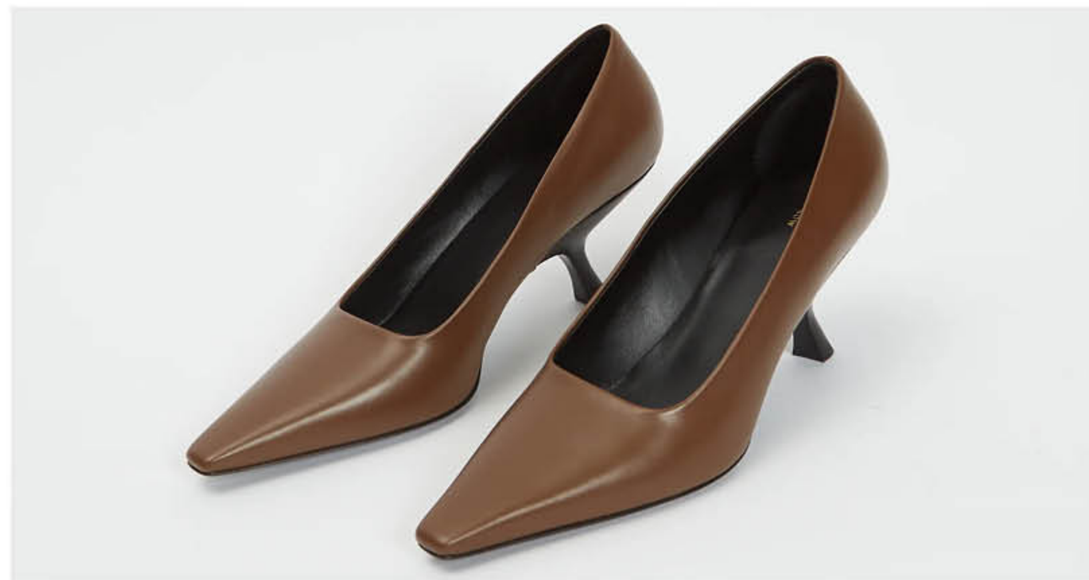
бренд THE ROW